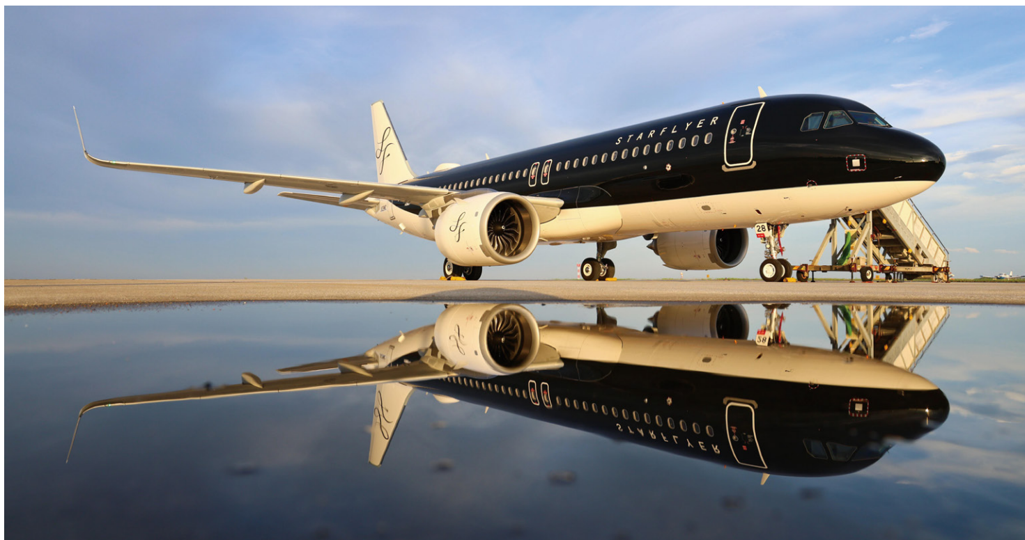
6月26日に北九州空港に到着したスターフライヤーのA320neo

エアバスは6月13日に仏トゥールーズでスターフライヤーのA320neo初号機を引き渡しました。スターフライヤーはA320neoにエアバスの最新客室「Airspace」を導入しています。これにより、同社は日本の航空会社として初めて「Airspace」装備のエアバス単通路型機を運航することになります。