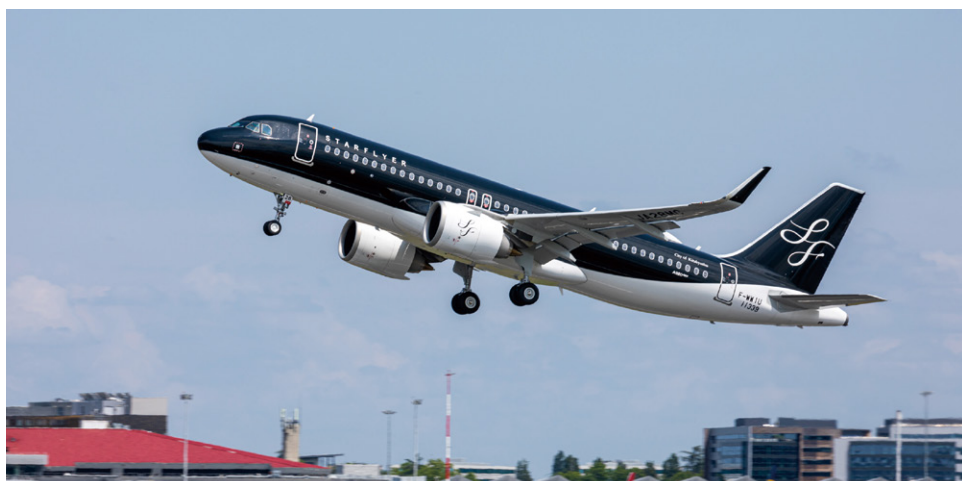
仏トゥールーズでの初飛行テスト