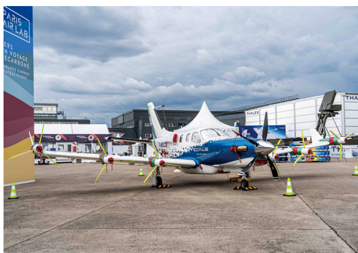
ダヘル、エアバス、サフランが共同開発する分散型ハイブリッド推進システム EcoPulse