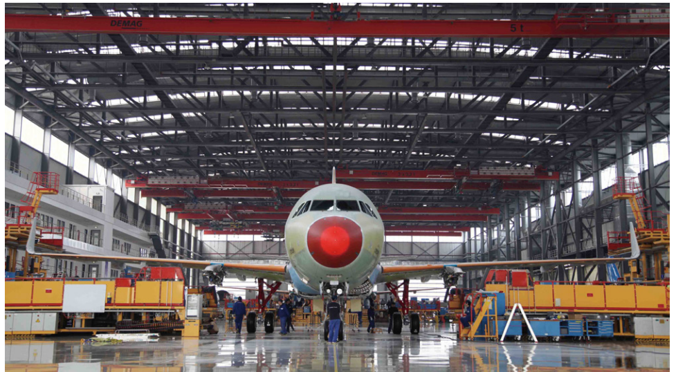
A320ファミリー生産数の増加に取り組むエアバス

エアバスと中国の関係は、約40年前の1985年、中国東方航空にA310を初めて引き渡したときから始まりました。2023年第1四半期末現在、中国で運航されているエアバス機は2,100機を超え、市場の50%以上を占めています。