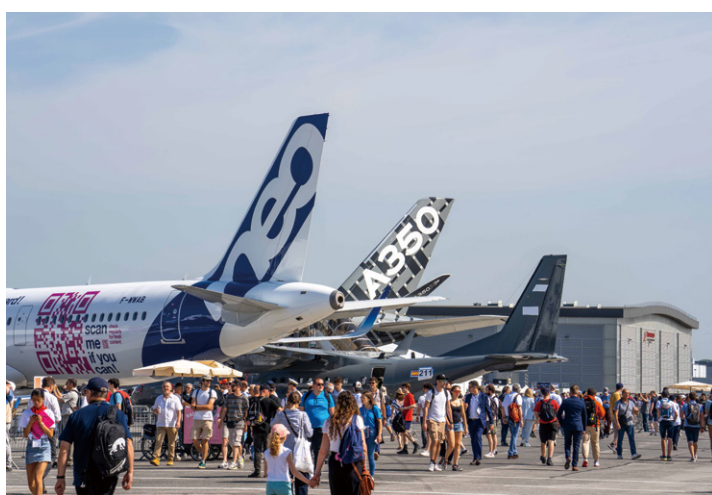
エアバス機の地上展示に注目する多くの来場者