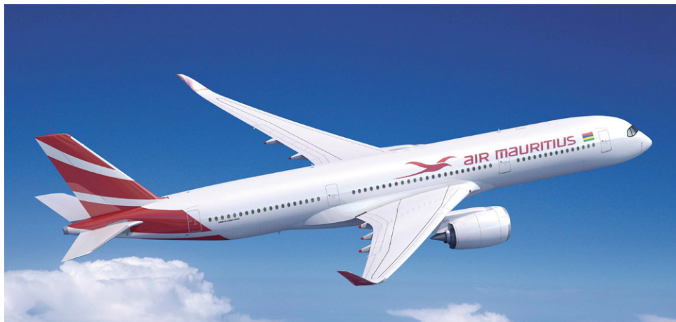
路線拡充に A350 を発注したモーリシャス航空

A350 は世界最新の効率的なワイドボディ機で、300 席から 410 席市場における長距離用航空機のリーダーです。A350 は既存の旅客機の中で最大の航続距離性能を備え、9,700 海里をノンストップで飛行することができます。