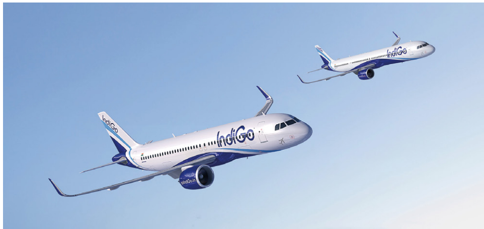
インディゴの合計発注数は 1,330 機に

れまでの発注分を合わせたインディゴの合計発注数は 1,330 機にのぼり、A320 ファミリーの世界最大の顧客の地位を確立しました。