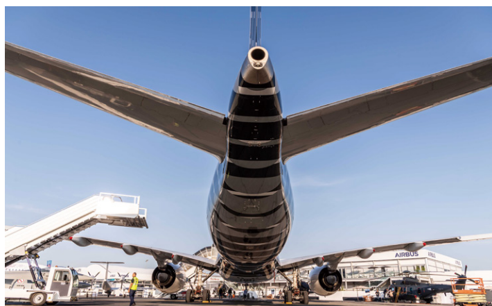
地上展示を行った A350-900