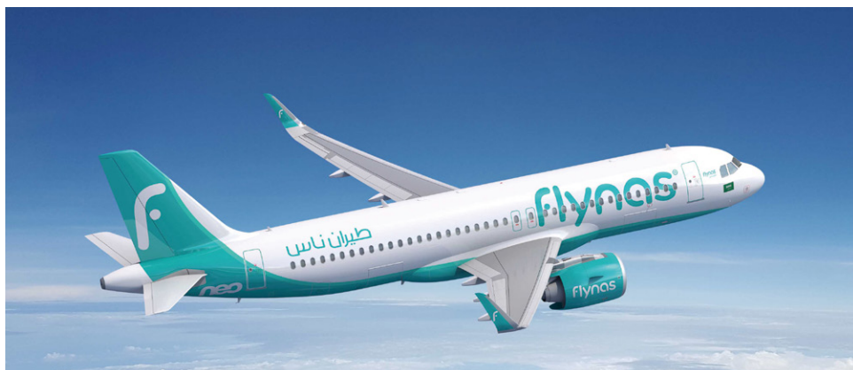
フライナスの保有機はすべてエアバス機

サウジアラビアの航空会社で中東を代表する低コスト航空会社であるフライナスが、A320neo ファミリーを 30 機発注しました。これにより、これまでの発注分を合わせたフライナスの A320neo に対する合計発注数は 120 機にのぼり、そのうち 10 機は超長距離型の A321XLR です。