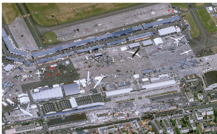
パリ航空ショーの衛星写真