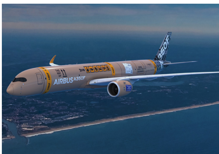
A350F の塗装デザイン公募で選定された最優秀デザイン